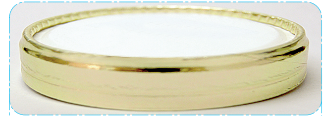
cardboard lid ring GOLD coperchio di carta con anello ORO

XX Tipo / Type CBW550 Data / Date 00/00/00